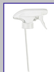
Spruzzino spray Cod.SP00090